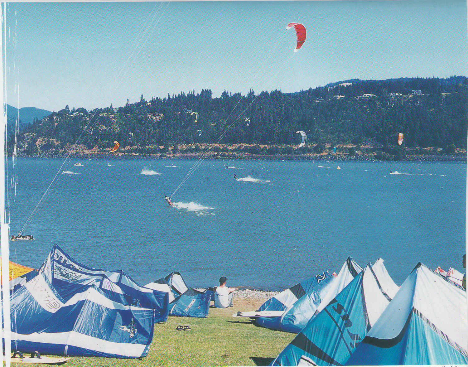
イベント・サイト