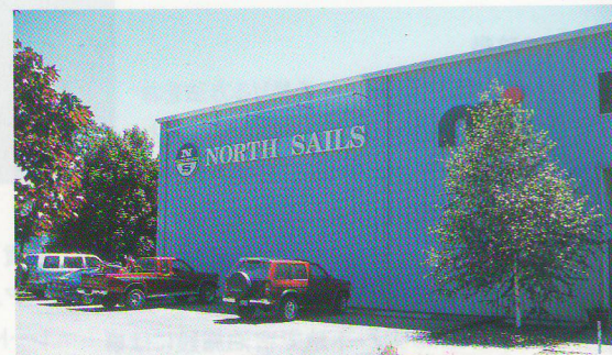
NORTH KITEBOARDINGの本社はSLING SHOTのすぐ隣にある。