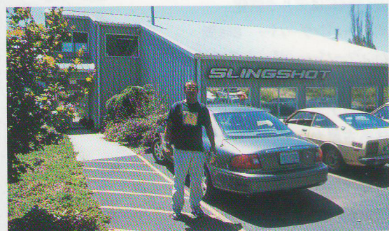
SLING SHOTの本社はHOOD RIVERの川の反対側ワシントン州側にある。

広い湯船にみんなで入る日本式とは違い、一つずつバスタブを割り当てられるのにはびっくり。普通の風呂と変わらないじゃん、と思ってたら風呂から上がったときにおじさんが別室でタオルに全身を来るんでくれる。別料金でマッサージもある。ま、話のタネにはいいかも。